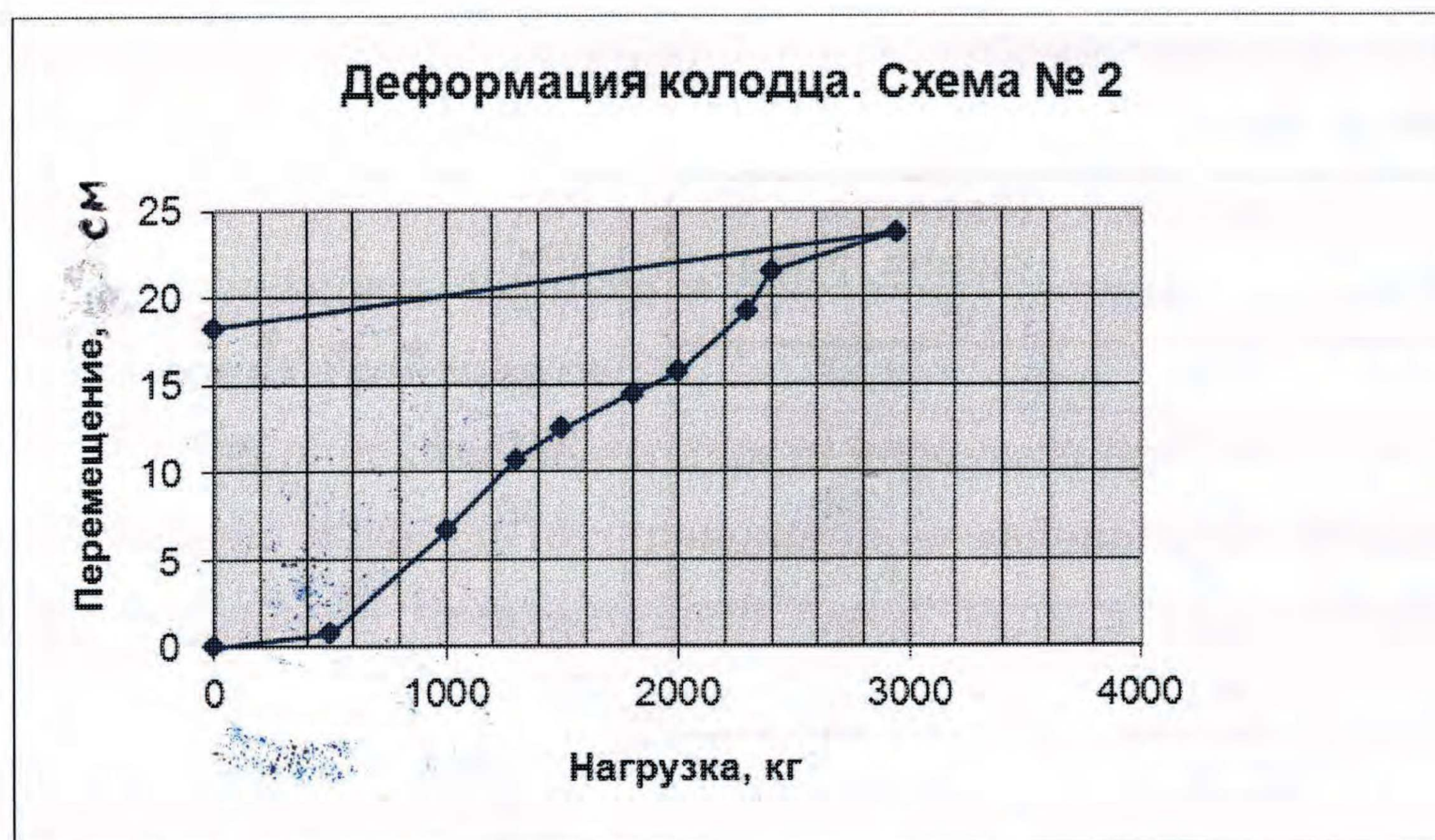
Рисунок 2 – График перемещения крышки люка при сосредоточенной нагрузке